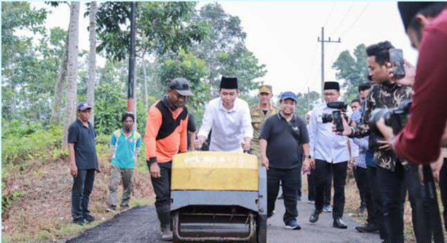
Aduan terkait dengan permintaan perbaikan jalan menjadi yang tertinggi dalam kanal Wadul Gus'e.

Diskominfo - Pasca diluncurkan sejak 14 Maret 2025, kanal Wadul Gus'e telah menerima lebih dari 11 ribu aduan. Berdasar data Wadul Gus'e, ada sebanyak 82 persen aduan yang telah ditindaklanjuti.